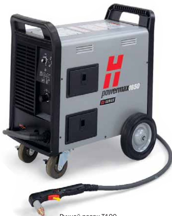
Ручной резак T100