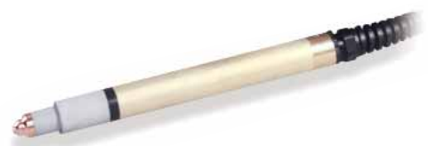
Механизированный резак T100M